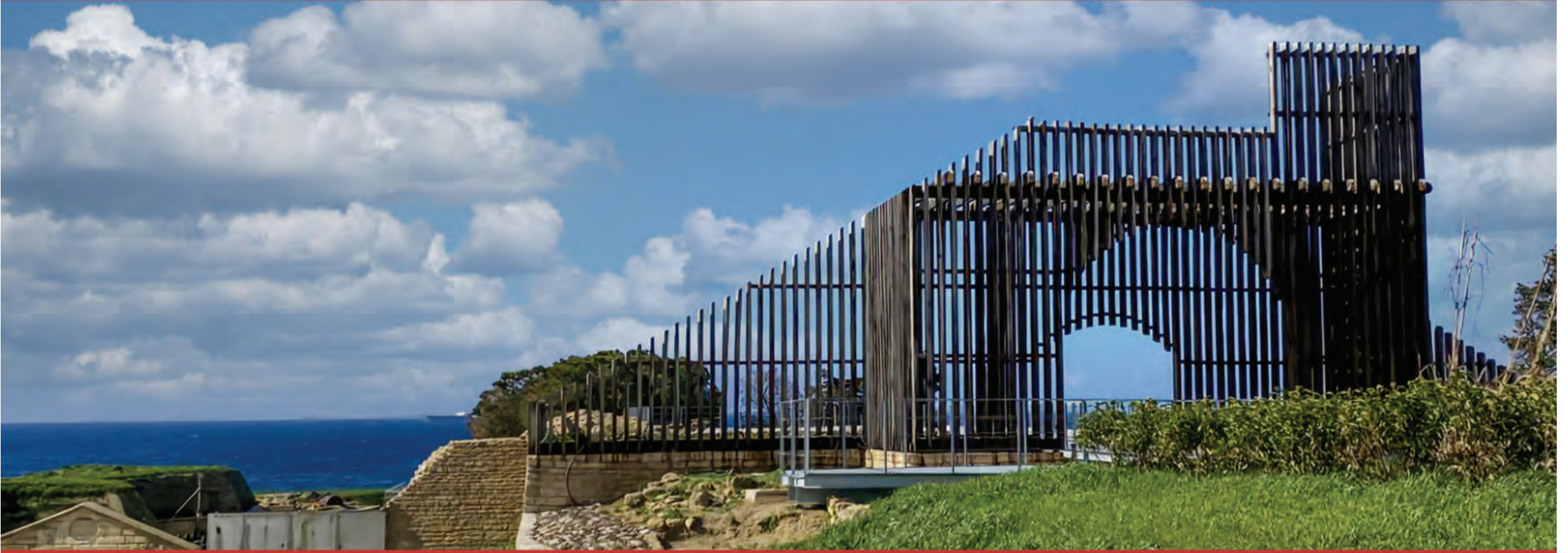
Seddülbahir Kalesi Bab-ı Kebir